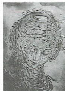
PORTADA Dalt-Oleo 1951 "Cabeza rafaelsca estallando"

Revista ODONTOS Edición N°4 - Agost-Sept-Oct.